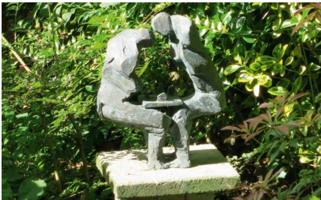
'Remis', Heinrich Brockmeier, brons, 37x30 cm.