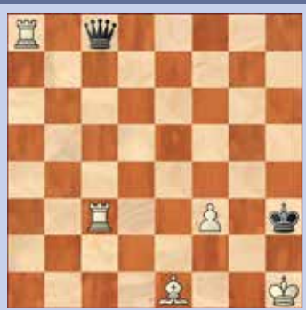
5. Wit geeft mat in drie