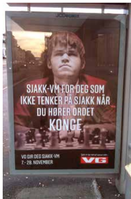
'Schaak-WK voor degenen die aan schaken denken als zij het woord KONING horen.'

Telegraaf ), dus aan media exposure geen gebrek. Een andere krant, Aftenposten , organiseert een schaakmatch Noorwegen versus de rest van de Wereld via de Internet Chess Club .