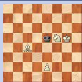
6. Wit geeft mat in zeven