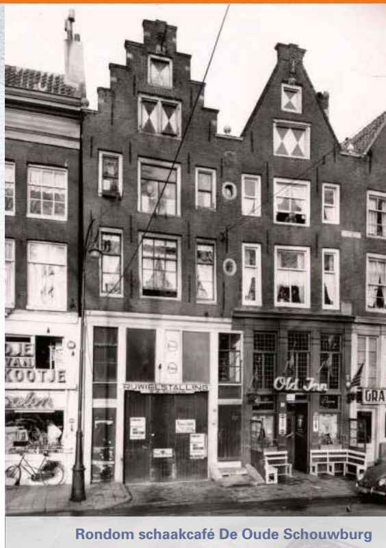
Rondom schaakcafé De Oude Schouwburg

rechter heeft een bord waarop hij alles ziet. Aan die scheidsrechter mag de speler over een voorgenomen zet, waartoe hij zich nog niet heeft verplicht, vragen of hij er iets mee kan slaan. 'Can I?' zei hij dan.