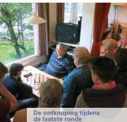
De ontknoping tijdens de laatste ronde

42... Rxe2 43.Bxg6 hxg6 44.Rh4 Rd2 45.Rc4 Rxd5 46.Rc7+ Kh6 47.Rd7 Kg5 48.Kg2 Kf5 49.Kf3 Ke6 50.Rb7 Rd3+ 51.Ke2 Rb3 52.b5 Kd5 53.Rf7 Ke6 54.Rb7 f5 54... Rb2+ 55.Ke3 d5 56.f3 d4+ 57.Kd3 Rb3+ 58.Ke2 Kd5 was even stronger. 55.b6 g5 56.Rb8 f4 57.g4 Kd5 58.b7 Ke4 59.f3+ Kd4 60.Rd8 Rb2+ 61.Kf1 Rxb7 62.Rxd6+ Ke3 Now it's all over. 63.Kg2 Rb2+ 64.Kh3 Rb1 65.Kg2 e4 66.Re6 Rb2+ 6 7.Kh3 Kxf3 68.Re5 Rb1 0-1