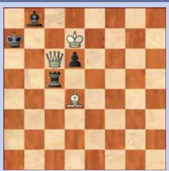
4. Wit geeft mat in twee