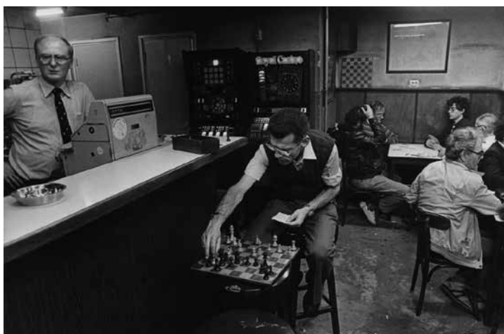
Stilleven in café het Hok