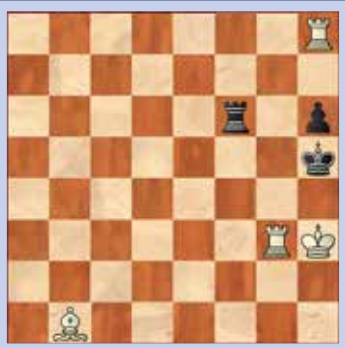
1. Wit geeft mat in twee

De oplossingen van deze schaakproblemen staan op pagina 28