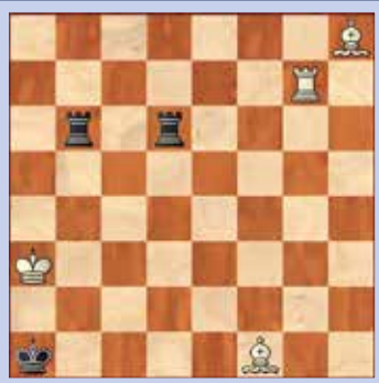
2. Wit geeft mat in twee