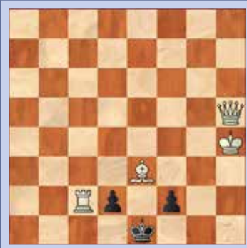
3. Wit geeft mat in twee