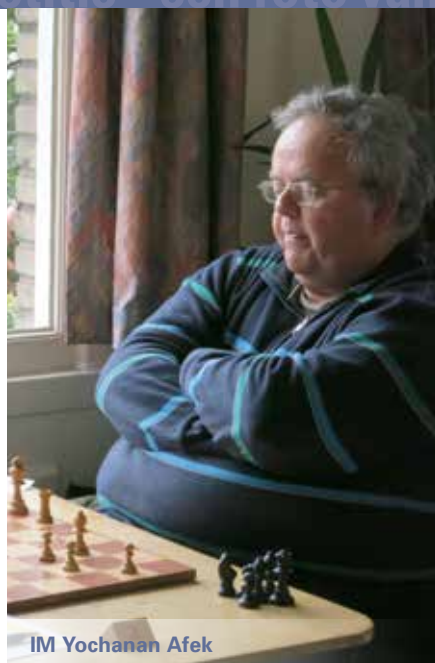
IM Yochanan Afek

29.h5 gxh5 I admit I was too impressed by the threat 30.h6. Weakening the position was really not necessary but by no means critical. 29... Qf5 was a reasonable alternative. 30.Re4 Rc7 31.Rh4 Rc4 32.Rxc4 32.Rxh5 would have been unpleasantly met by Qf5.