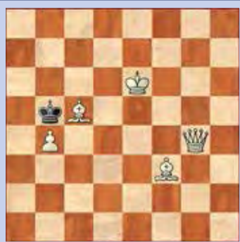
2. Wit geeft mat in twee