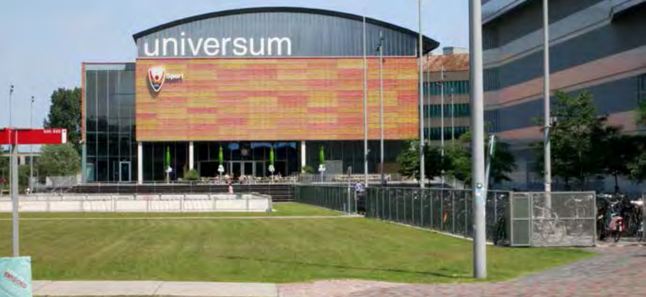
Het Universum, de prachtige speelhal van het Science Parktoernooi