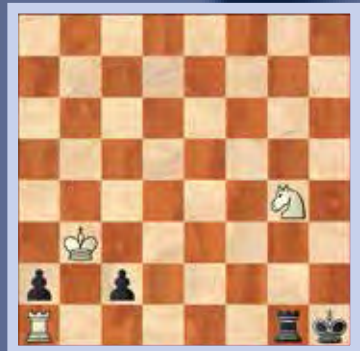
4. Wit speelt en maakt remise