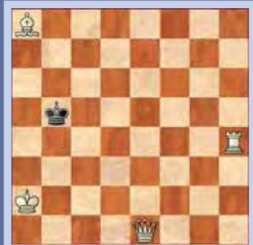
3. Wit geeft mat in twee