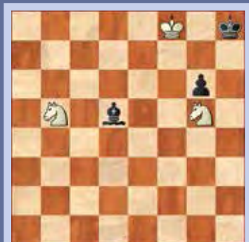
6. Wit geeft mat in vier