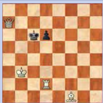
1. Wit geeft mat in twee

De oplossingen van deze schaakproblemen staan op pagina 44