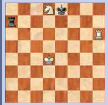
2. Wit speelt en wint