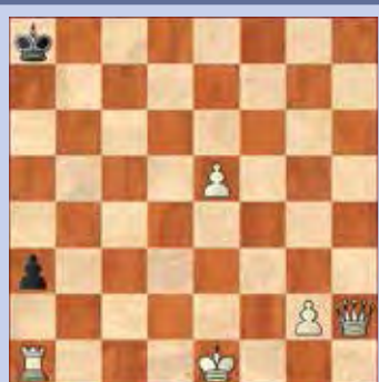
5. Wit geeft mat in drie