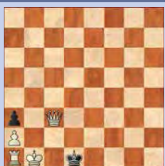
4. Wit geeft mat in drie