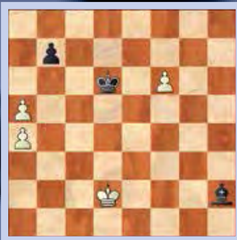
3. Wit speelt en maakt remise