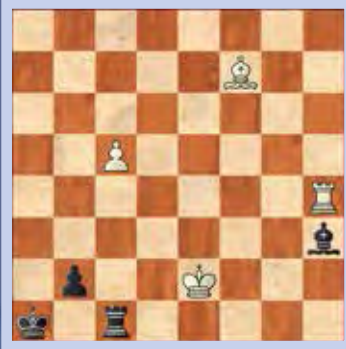
1. Wit speelt en wint

De oplossingen van deze schaakstudies staan op pagina 44