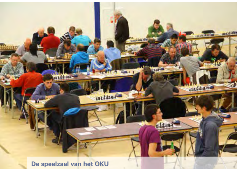
De speelzaal van het OKU

Een interessante stelling deed zich voor na 34.Dxc3. Zie diagram 2.