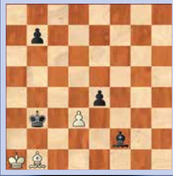
1. Wit speelt en maakt remise

De oplossingen van deze schaakproblemen staan op pagina 32