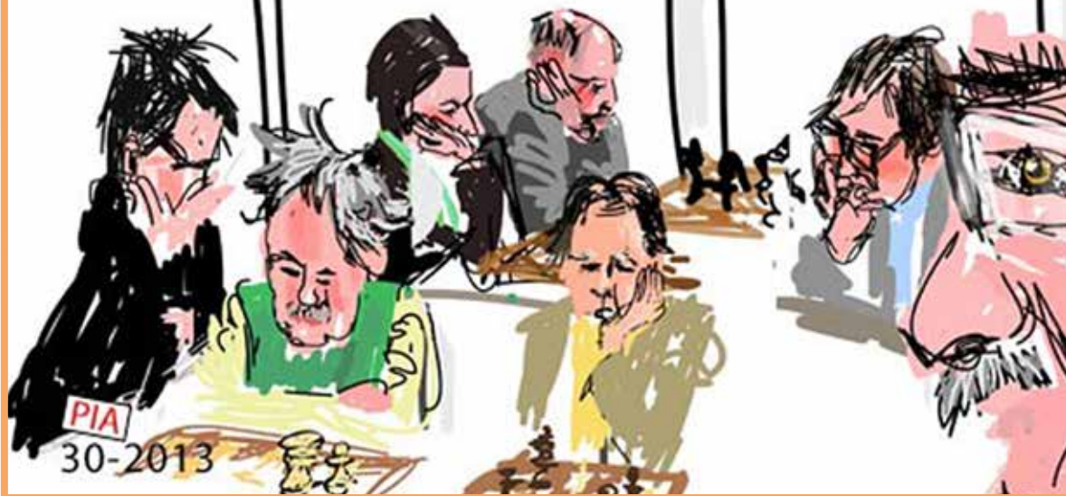
KNSB-Caissanen in actie op 6 april jl. (tekening Pia Sprong)