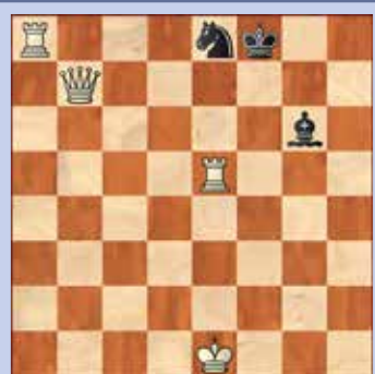
4. Wit geeft mat in twee