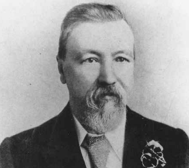
The Daily Chronicle, reproduced on pages 87-88 of the 1 May 1895 issue of the Chess Player's Chronicle: