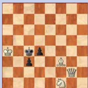
2. Wit geeft mat in twee