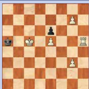
5. Wit geeft mat in drie