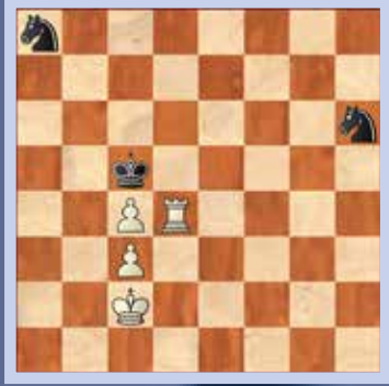
2. Wit speelt en wint