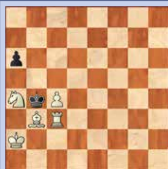
6. Wit geeft mat in drie