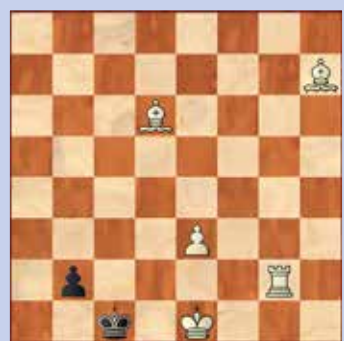
1. Wit geeft mat in twee

De oplossingen van deze schaakproblemen staan op pagina 32