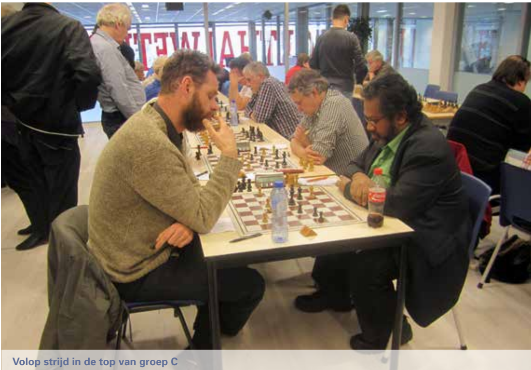
Volop strijd in de top van groep C

1.e4 e5 2.Pf3 Pc6 3.d4 exd4 4.Lc4 Pf6 5.0-0 Het Schots Gambiet en toevallig de variant die ik vroeger zelf speelde. De andere gaat verder met 5.e5. 5...Pxe4 6.Te1 d5 7.Lxd5 Dxd5 8.Pc3 Da5 9.Pxe4 Le6 10.Peg5 0-0-0 11.Pxe6 fxe6 12.Txe6 Ld6 13.De2 Dh5 14.De4?! Veiliger is 14.h3 14...Tde8 15.Lf4? Lxf4? Ik weet er niet van te profiteren. 15...Pd8! En wit zit in de problemen. 16.Txe8+ Txe8 17.Dxf4 Td8 De stelling is in evenwicht, maar een foutje kan meteen drastische gevolgen hebben. 18.Td1 h6 19.a3 Dc5 20.De4 a5 21.h3 Kb8