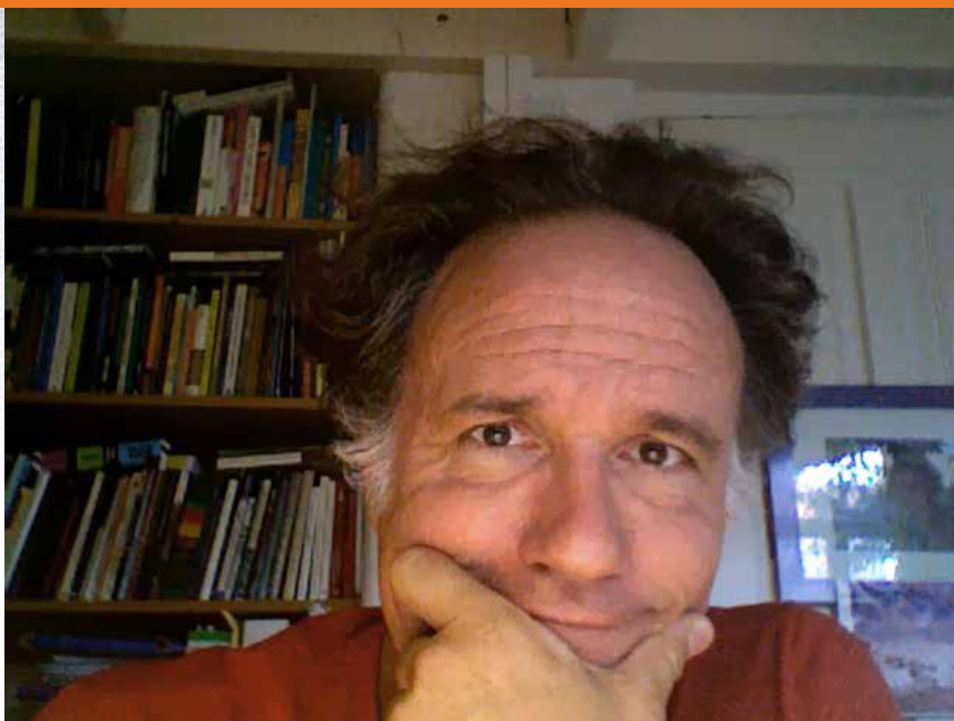
Een zelfportret van de winnaar

Dc2+! 35.Le2 Pc3 De FBE blijft irritant en ondertussen