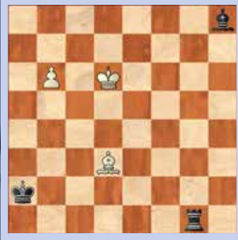
3. Wit speelt en maakt remise