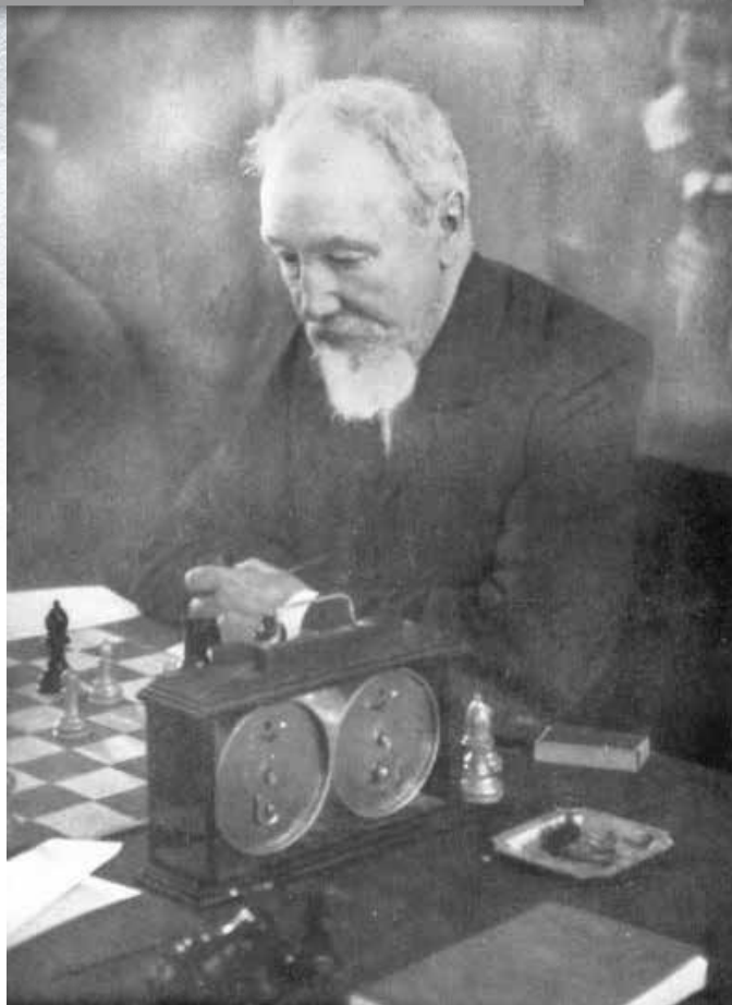
The Black Death