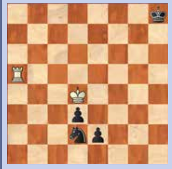
4. Wit speelt en maakt remise