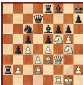
Blackburne - Nimzowitsch, stelling na 26.Pf2-g4