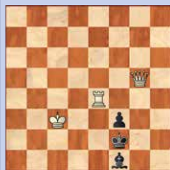
3. Wit geeft mat in twee