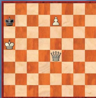
② Wit geeft mat in 2