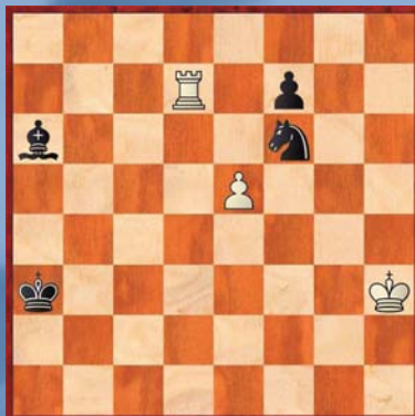
③ Wit speelt en wint