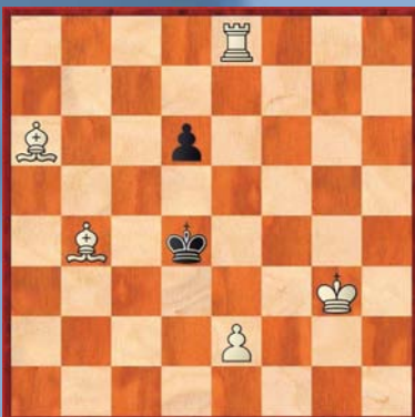
④ Wit geeft mat in 3