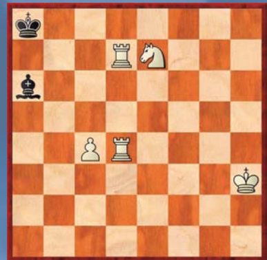
③ Wit geeft mat in 3