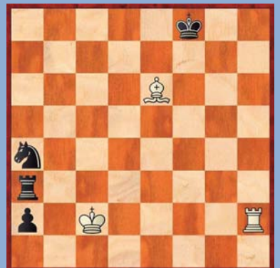
④ Wit speelt en maakt remise