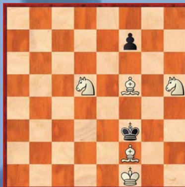
⑤ Wit geeft mat in 4