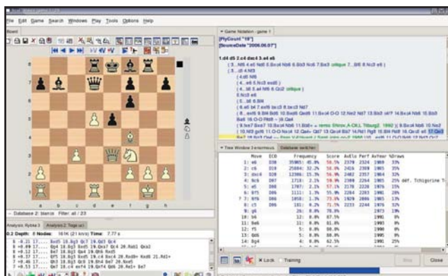
De interface van Scid