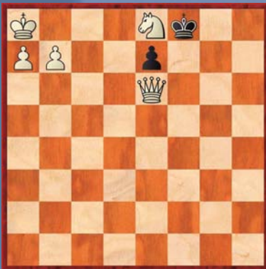
① Wit geeft mat in 2

De oplossingen van deze schaakproblemen staan op pagina 44.