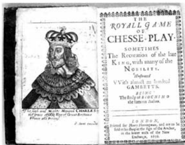
The Royall Game of Chesse-play van Greco, 1656

Een avontuurlijk leven dus. Haast net zo avontuurlijk als zijn schaakpartijen. Dat weten we, want Greco hield wél z'n boekhouding bij. Hij rangschikte alles op opening en in