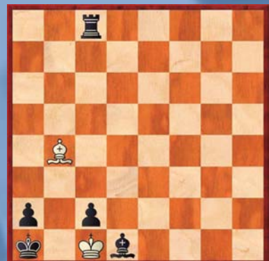
⑥ Wit geeft mat in 5