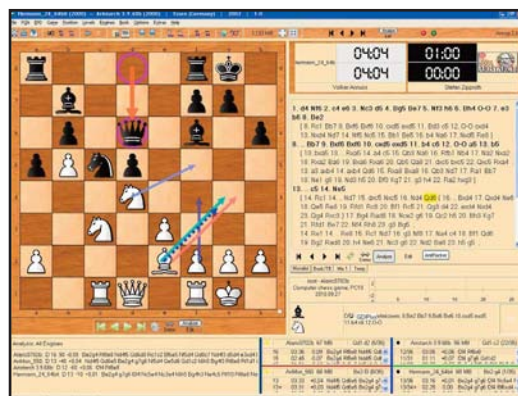
De interface van Arena