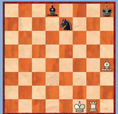
② Wit speelt en wint