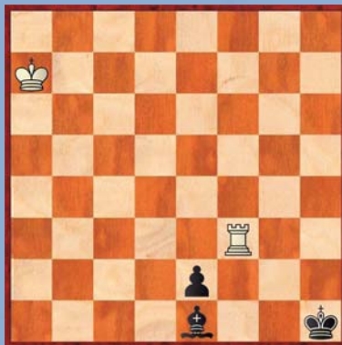
① Wit speelt en maakt remise

De oplossingen van deze schaakstudies staan op pagina 44